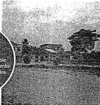
PLAZA DE ARMAS DE CACATACHI